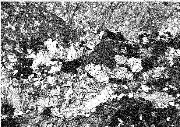
图3 甲子山单元岩石显微特征(+) \times 35

(2) 甲子山单元巨斑状中细粒含辉石角闪黑云正长岩。肉眼观察为烟灰色,似斑状结构,块状构造,基质为中细粒半自形粒状结构,以斑晶巨大为特征(一般 3~5 cm,最大可达 15 cm),含量 40%。镜下观察岩石具似斑状结构。主要矿物为斜长石 14.9%、钾长石 60.3%、黑云母 12.3%、角闪石 5.2%、辉石 6.7%,基质粒径介于 0.1~3 mm,副矿物榴石、磁铁矿(图 3)。