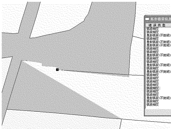
图 3 面域部分信息丢失拓扑错误

(3) 对面域进行切割或其他相关操作后, 拓扑检查后出现某些面域信息部分缺失的状况(图 3)。这种现象的产生一部分原因是其他拓扑错误在重复处理的过程中, 错误并未完全被处理掉, 从而产生了附带拓扑错误。另一种可能是该区文件中有较多的拓扑错误, 在对其中的一块面域进行合并或切割后, 面域形成不完整面域, 造成面域部分信息丢失的状况 [2] 。