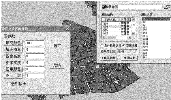
图 4 地类图层号统改示意图

(2)利用工具栏检查窗口中的工作区属性检查,选中需要提取的地类,如耕地,直接选中 DLDM 中 11 这一项即可,然后进行属性统改,将其图层号改为 1 或者非 0 数字即可(图 4)。