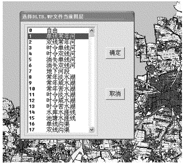
图 5 修改当前图层号示意图

通过这种方法提取的区图层有几个优点:一是图层提取法避免了重复提取的情况,同时在底图没有拓扑错误的情况下,所提出的图层是肯定不会出现任何拓扑错误的,这样为后期的制图工作打下了良好的基础,可以避免因拓扑错误而导致的错误处