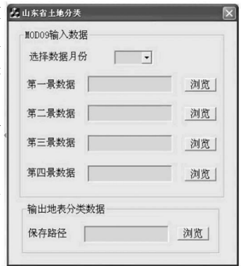
图 2 土地利用类型自动分类系统界面

土地分类模块是生成土地分类产品。MOD09 数据为 8 天合成数据,每月份含四景 MOD09 影像,为了尽可能降低大气和云的影响,将每月的四景数据进行基于像元的数据融合,即对四景影像对应的同一像元选择其反射率最小值作为该月数据的地表反射率值并用于土地分类。因此土地分类模块通过读取每月份的 MOD09 数据及其月份,该模块根据月份查找到对应的决策树,后将四景影像基于像元进行数据融合,将融合后的像元进行地表分类生成土地利用类型分类数据(图 2)。