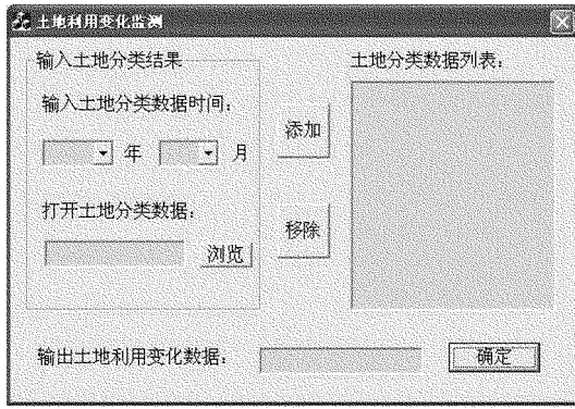
图 3 土地利用变化监测系统界面

较好的一致性。对长时间序列的土地分类结果进行比较,依据耕地和城市建设用地短时间内不会产生很大波动这一特性,通过不同时间的土地利用变化趋势来验证土地分类结果,表明农田和城市建设用地相对稳定,森林和草地的变化趋势符合植被随时间的生长规律。