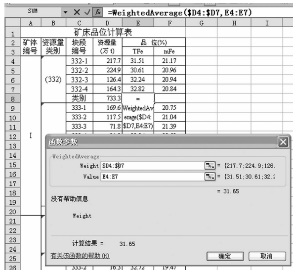
图 4 函数参数输入

如图 4 所示,鼠标点击“E8”单元格,输入“=”号,点击左上角“函数”下拉列表中的“其他函数…”,出现“插入函数”列表框,选择“WeightedAverage”后“确定”,显示“函数参数”文本框。