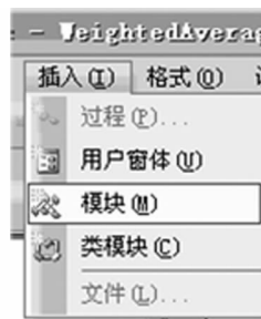
图 2 添加模块

‘ \Sigma (权 \times 值), 如 \Sigma (样长 \times mFe)、 \Sigma (矿石量 \times mFe)