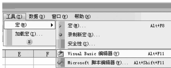
图 1 选择 visual Basic 编辑器

Function WeightedAverage (Weight As Range, Value As Range) 加权平均计算。Weight—权; value—值 sWeight = Application. WorksheetFunction. Sum (Weight) 求和, 如求样长、求矿石量 sWeightValue = Application. WorksheetFunction. SumProduct(Weight, Value)