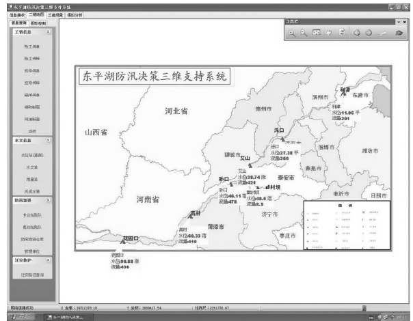
图 2 水情地图(当前水位、流量)

以 1:1 万航空彩色影像和数字高程模型数据 (DEM) 为基础,建立了东平湖三维场景,展示了东平湖区地形、地貌和重要防洪工程信息。为数字东平湖建设建立了三维工作平台,实现了三维场景漫游、防汛工程查询和定位、防汛计算、洪水淹没等功能(图 4)。