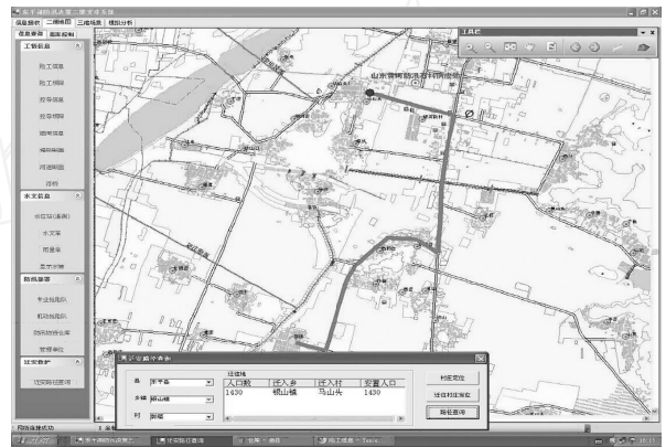
图 3 迁安救护计算