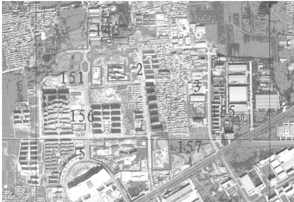
图 2 根据遥感影像怀疑的新增建设用地图 (图内数字标注区域为怀疑新增建设用地)

根据国家和各省土地变更调查有关要求,在总结以往土地变更调查工作经验的基础上,结合实际情况,制订土地利用更新调查技术规定,确定以建设用地占用耕地为主要调查对象。结合国家相关规程和各省有关规定,利用遥感工作底图,把有变化的地类图斑、线状地物、零星地类,逐一判读、实地对照,利用 GPS 技术实地丈量、补测,记载,绘制草图,做到图、数、实地一致(图 2)。