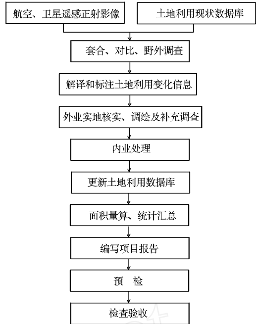
图 3 数据库更新流程图

(4)利用土地利用现状数据库系统,输入更新后的图形、数据及属性资料,运用计算机进行内业图件与属性数据的处理、面积量算和统计汇总,建立农