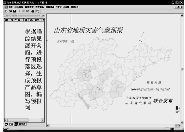
图 3 预报会商主界面示意图

的主要功能界面之一,在该界面上预报人员可以进行本地和远程会商修改,也可以用于预报产品的签批(图3)。