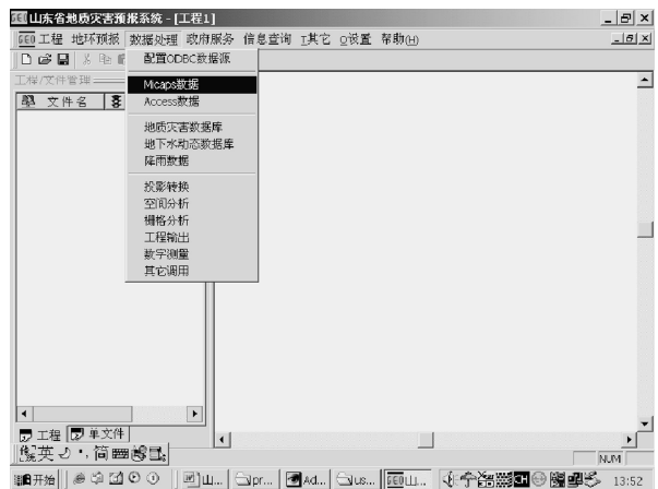
图 1 预报软件主界面示意图

(1)软件主界面。预报主界面主要包括:菜单栏、工具栏、文件添减区、编辑区(图 1)。该主界面具有简单、直观、明了和功能较齐全的主要特点。