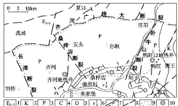
图 1 济北地热田地热地质略图

该区位于济南单斜前缘, 受北部齐河—广饶深大断裂的影响, 断裂构造发育, 钻孔附近主要有 NNE, NNW 向 2 组断裂, 它们归属于鲁西系外旋回