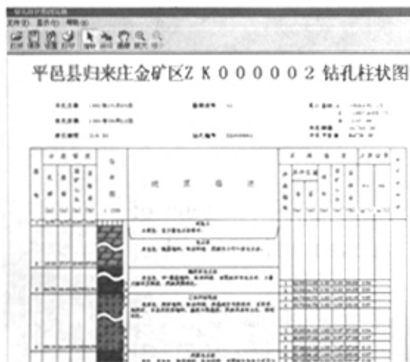
图6 柱状图浏览窗口

在实践中使用该系统可以极大地提高工作效率。配备笔记本电脑的野外地质人员,完全可以在野外现场完成钻孔原始编录数据的入机,进而利用该系统的柱状图生成、浏览和预检编录功能,及时