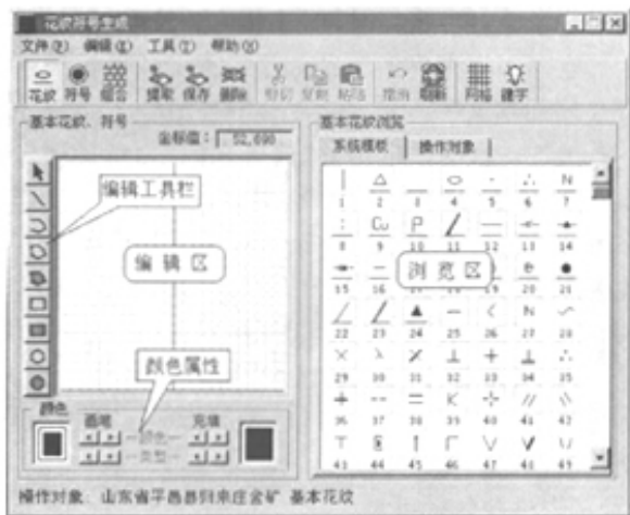
图2 基本花纹生成窗口

性可以选择画笔的颜色、画笔类型(虚线、实线等),可以选择充填区域的颜色、区域填充类型(水平直线、垂直直线等)。利用工具菜单中的一些菜单子项可以调节编辑精度。编辑完成后按工具栏中保存图标,根据提示给已编辑好的基本花纹一个适当的代码予以保存,这时若打开操作对象栏,就可看到刚才的基本花纹。只有操作对象中的基本花纹才可以被组合花纹生成时利用。