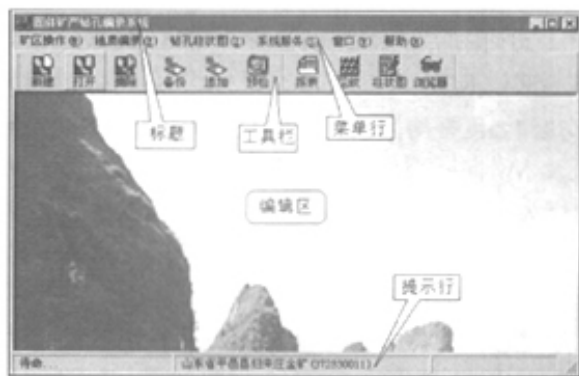
图 1 CHINAZK 系统主控窗口

固体矿产钻孔数据采编系统 (CHINAZK ① ) (图 1, 以下简称 CHINAZK 系统) 提供了实现钻孔资料数字化的手段。它不但可以对原有纸介质资料数字化, 还可以对新施工钻孔的信息直接入机编录管理, 也为钻孔资料的标准化、规范化管理, 为绘图质量和效率的提高提供了新的手段。野外地质工作人员利用该系统方便快捷的钻孔柱状图生成功能, 可以对矿区情况及时进行直观分析对比和质量检查, 进而有效规划下一步的勘查工作。