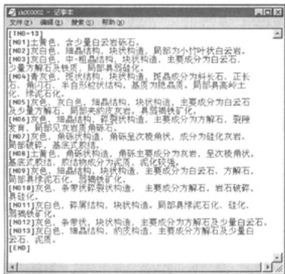
图 4 地质描述文本文件格式

与上一层的关系,而非我们习惯中与下一层的关系;二、矿区花纹代码对应于矿区花纹库中的组合花纹代码,统一花纹代码对应的是省市花纹库中的组合花纹代码;三、地质描述栏中的内容由于受系统界面的影响,直接录入时很不方便,操作过程中可以把钻孔的地质描述保存为一个具有特定格式的纯文本文件。图 4 为 ZK000002 地质描述的纯文本文件,其中 [TNO=13]表示 ZK000002 孔被分为 13 层,[TNO1]及其后的文字为第一层的地质描述,[END]为结束控制符。在钻孔地质编录窗口“地质描述”栏下,选中 ZK000002 第一层对应的单元格,按功能键 Ctrl-R,在随后弹出的对话框中指定文本文件 ZK000002.txt,确定后该孔的地质描述将自动填充到对应单元格中。