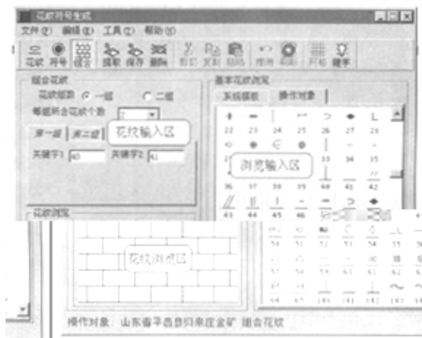
图3 组合花纹生成窗口