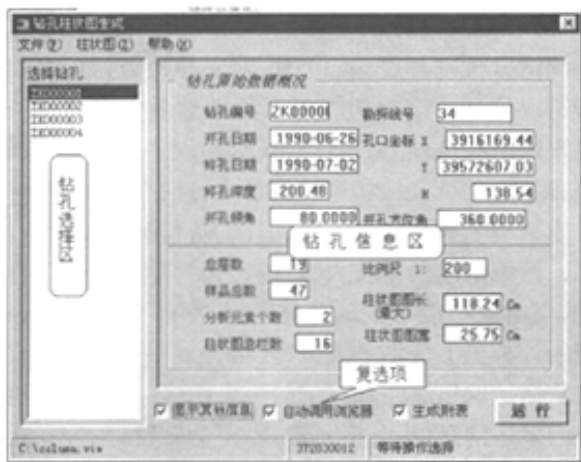
图5 柱状图生成窗口

(1) 通过单击 CHINAZK 系统主控窗口钻孔柱状图菜单项下的柱状图生成子项或主控窗口工具栏中的柱状图图标进入柱状图生成子系统(见图5)。图中的钻孔选择区用来选定待操作的钻孔工程;钻孔信息区显示选定钻孔的数据汇总信息;复选项中的“显示其他信息”决定信息区的下半区是否出现,“自动调用浏览器”选项决定当柱状图图形文件生成后是否调用钻孔柱状图浏览器显示结果,“生成附表”选项决定是否在钻孔柱状图正文后生成附表(钻孔弯曲度测量结果表、孔深测量检查结果表和责任表)。